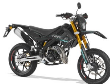
MRT SM BLACK SERIES 50