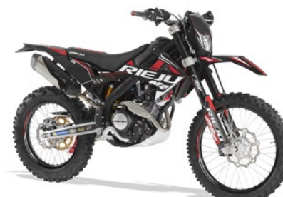
MR PRO 125