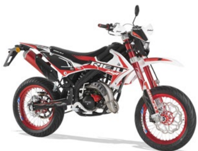
MRT SM TROPHY 50