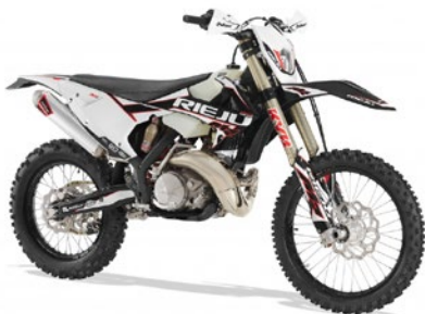
MR RACING 200 | 250 | 300