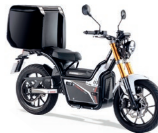
NUUK CARGO 6 kW