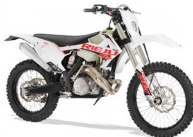
MR RANGER 200 | 300