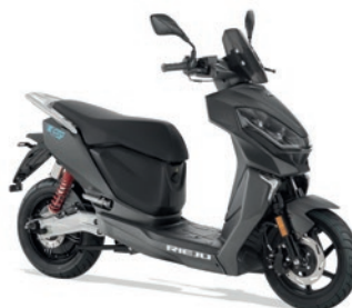
E-CITY 1,2 kW | 3 kW