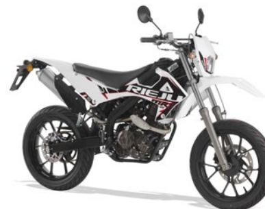
MRT LC 125