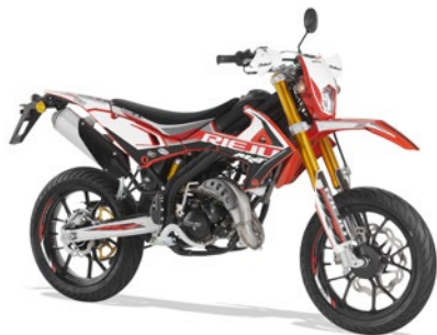
MRT SM PRO 50