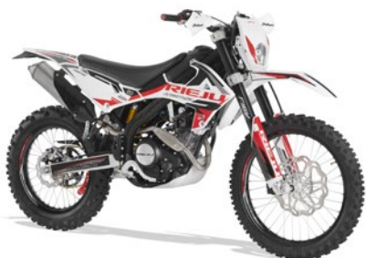
MARATHOM PRO 125