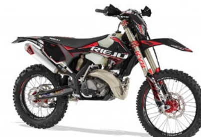
MR PRO 250 | 300